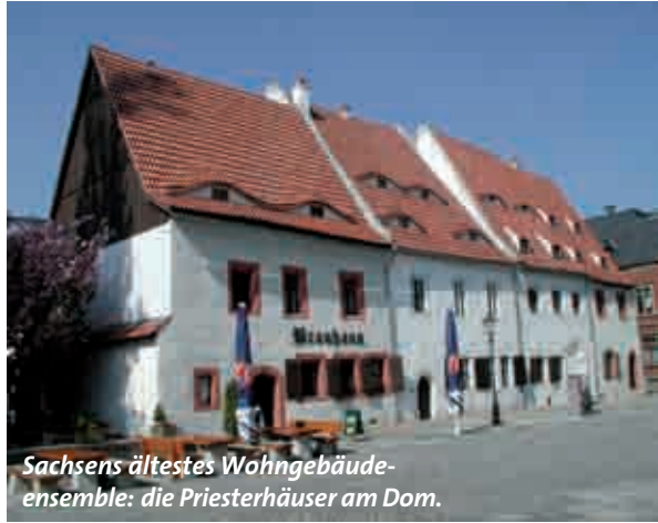
Sachsens ältestes Wohngebäudeensemble: die Priesterhäuser am Dom.

Vergangenheit zum Anfassen bieten auch die Priesterhäuser im Herzen der Zwickauer Innenstadt. Direkt gegenüber dem Zwickauer Dom befindet sich Sachsens ältestes zusammenhängendes Wohnhausensemble. Heute ist darin die stadtgeschichtliche Ausstellung untergebracht.