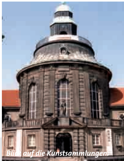
Blick auf die Kunstsammlungen

Das Robert-Schumann-Haus bietet die weltweit größte Sammlung von Originalen Robert Schumanns, Clara Wiecks und deren Zeitgenossen. Bei Schumannfreunden überall auf der Welt ist das Haus die erste Adresse, nicht nur wegen seines umfangreichen Archivs, sondern vor allem auch wegen seiner erstklassigen Konzerte.