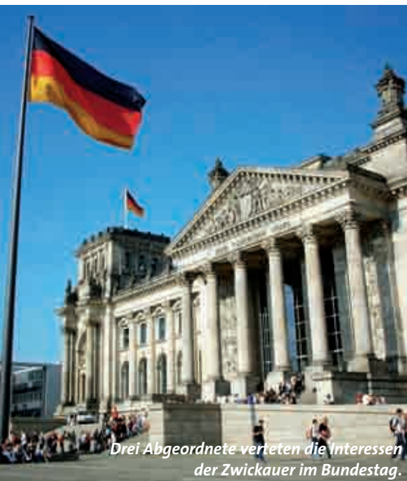
Drei Abgeordnete vertreten die Interessen der Zwickauer im Bundestag.

Alle Adressen finden Sie unter den Kontakten auf den Seiten 40 bis 51.