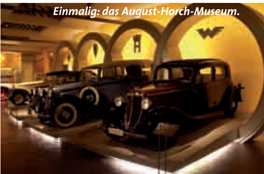
Einmalig: das August-Horch-Museum.

Zwickaus Museen sind einmalig. Das August-Horch-Museum zum Beispiel ist das einzige Automobilmuseum in Deutschland, das sich an einem originalen Standort der Automobilproduktion findet. So kann der Besucher in Zwickau unter anderem das Arbeitszimmer des Automobilpioniers August Horch besuchen, der genau in diesem Zimmer den Grundstein für das Autoland Sachsen legte. Bei einem Rundgang durch das Museum können die Besucher diese Geschichte hautnah mitverfolgen und eintauchen in die Anfänge der Mobilität und erfahren, wie deren Zukunft aussieht.