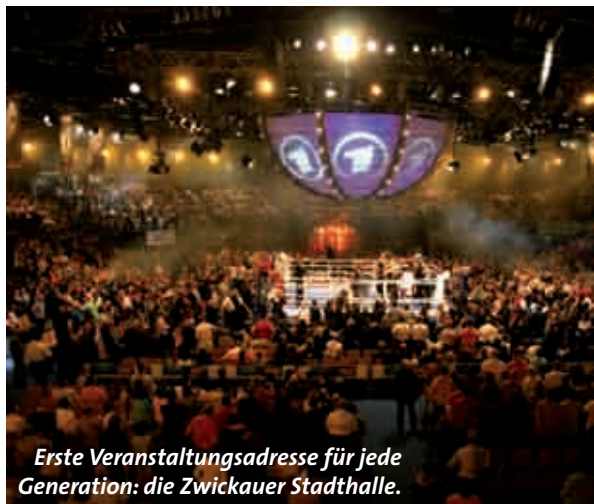
Erste Veranstaltungsadresse für jede Generation: die Zwickauer Stadthalle.

Das Freizeitangebot in Zwickau muss sich nicht verstecken. Eine der wichtigsten Adressen ist die Stadthalle neben dem Glück-Auf-Center. Ob Reisemesse oder WestsachenBau, ob Sportgroßereignis, Pferde-Event, Rock- oder Popkonzert oder Fernsehliveübertragung von Unterhaltungssendungen – die Stadthalle ist als Veranstaltungsort aus Zwickau nicht mehr wegzudenken. Der Golfplatz, verschiedenste Sportstätten wie Sporthallen und Tennisplätze und nicht zuletzt auch Diskotheken und Clubs bereichern mit ihren Offerten das Spektrum der Freizeitangebote. Überhaupt hat Zwickau ganz unverwechselbare Veranstaltungsorte, die Erlebnishunger und die Suche nach historischen Spuren gleichermaßen bedienen. So ist das Konzert- und Ballhaus „Neue Welt“, Sachsens schönsten und größten Terrassensaal im Jugendstil.