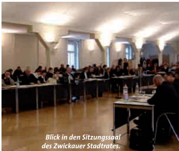
Blick in den Sitzungssaal des Zwickauer Stadtrates.

Entsprechend der derzeit gültigen Hauptsatzung gibt es in Zwickau acht Ausschüsse: Haupt- und Verwaltungsausschuss, Finanz- und Liegenschaftsausschuss, Bau- und Verkehrsausschuss, Kultur- und Bildungsausschuss (zugleich Eigenbetriebsausschuss des Robert-Schumann-Konservatoriums), Sozialausschuss, Umweltausschuss, Wirtschaftsausschuss und Stadtentwicklungsausschuss, Jugendhilfeausschuss, Krankenhausausschuss. Hinzu kommt der