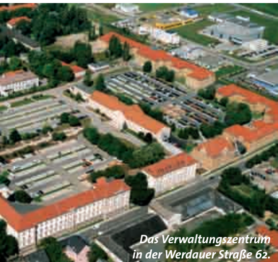
Das Verwaltungszentrum in der Werdauer Straße 62.

montags 8 bis 12 Uhr und 13 bis 15.30 Uhr dienstags 8 bis 12 Uhr und 13 bis 17.30 Uhr mittwochs 8 bis 12 Uhr und 13 bis 15.30 Uhr donnerstags 8 bis 12 Uhr und 13 bis 15.30 Uhr freitags 8 bis 11 Uhr Telefon: 0375/83 10 56, 0375/83 10 57 Fax: 0375/83 83 83 E-Mail: buergerbuero@zwickau.de